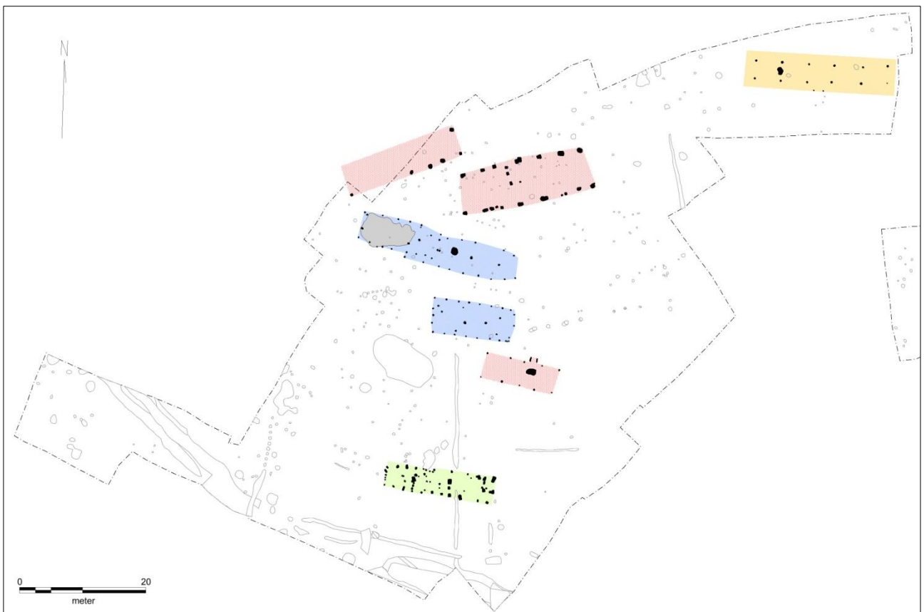
Figur 3. Oversigtsplan med de forskellige huse i udgravningen. Stenalder med huseblå, bronzealder med husegul, middelalder med rød og renaissance med husegrøn. Sydvestjyske Museer.