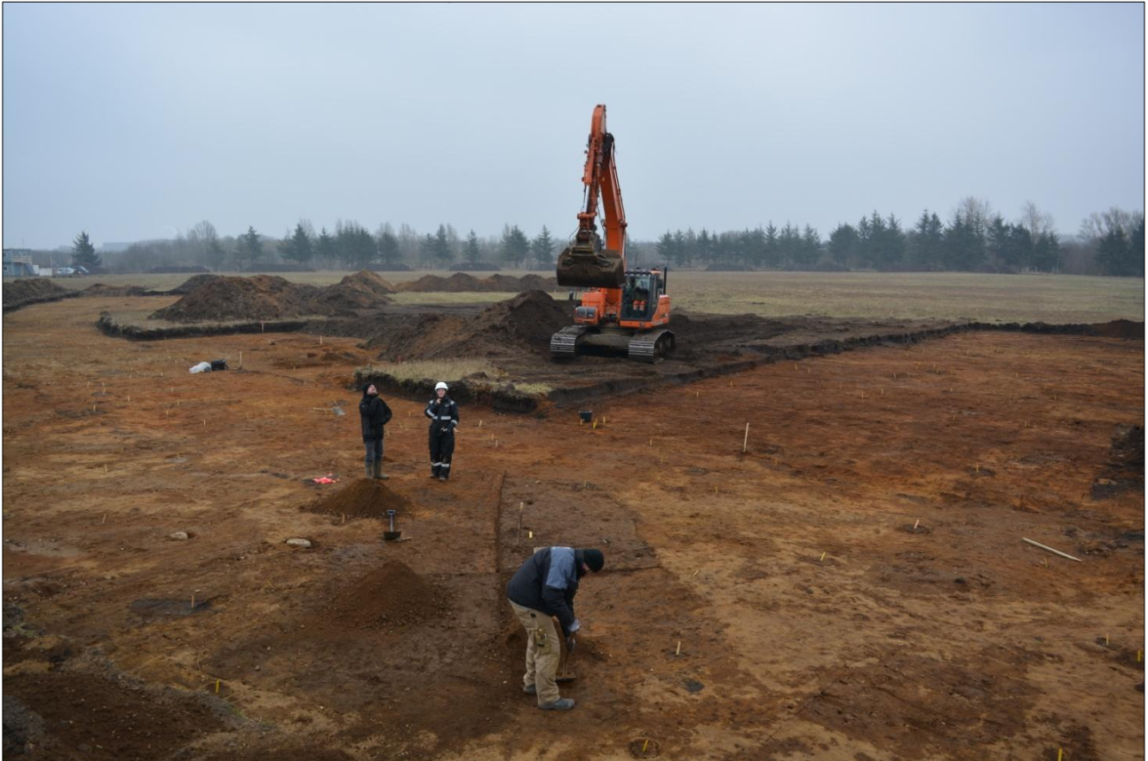
Figur 1. Arkæologer udgraver forsænkning i et stenalderhus på Ravensbjerg Bakke. Sydvestjyske Museer

I februar 2015 udgravede arkæologer fra Sydvestjyske Museer en del af arealet for det nye boligområde Ravensbjerg Bakke. I den forbindelse stødte vi på velbevarede huse og gårde fra stenalder og bronzealder samt middelalder og renaissance.