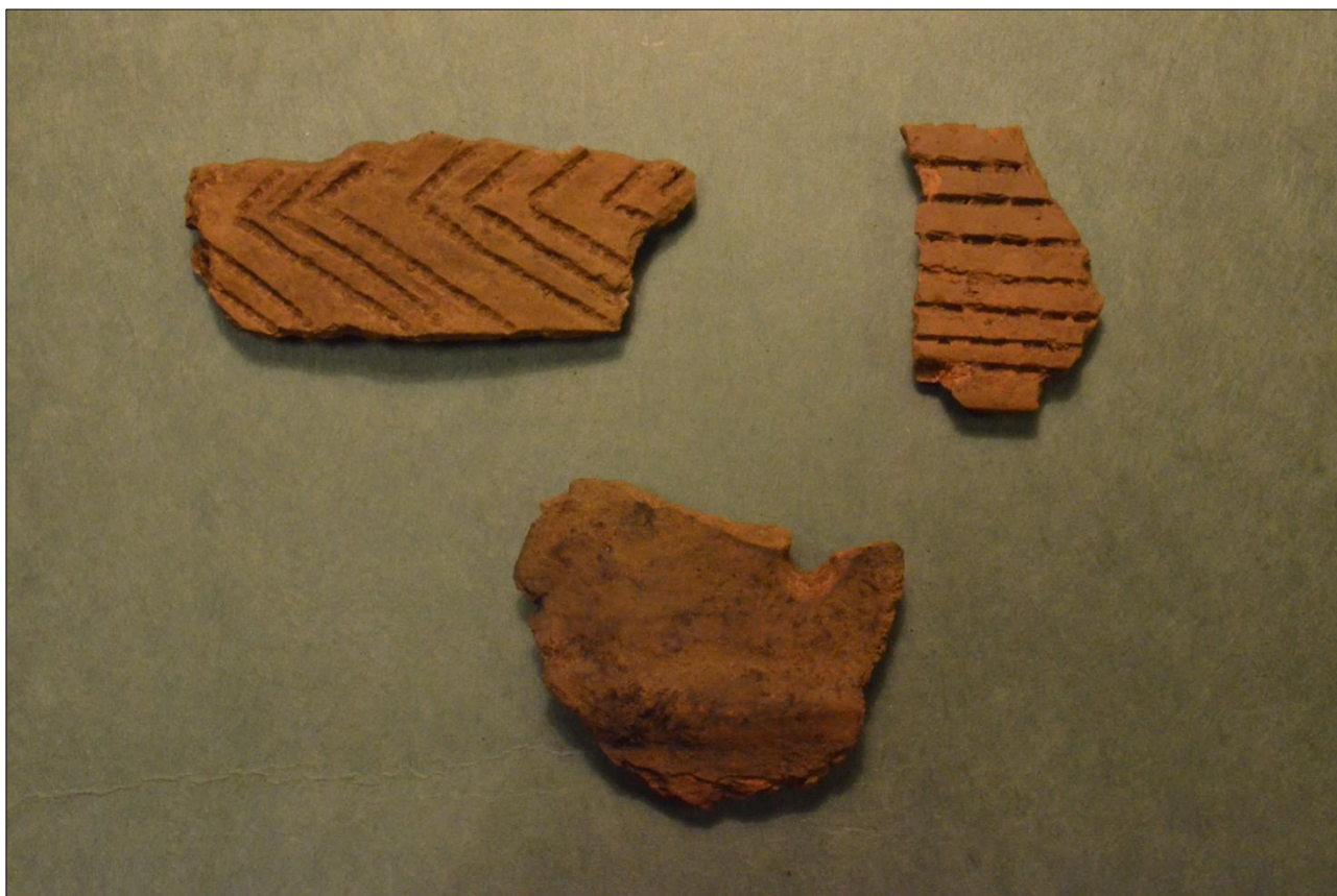
Figur 4. Keramikskår fra bondestenalderen dekoreret med tandstok og pindstik. Det nederste skår har en gennembrydning og er måske del af et hængekar. Sydvestjyske Museer.

På de ældste matrikelkort fra 1786 ser vi udstrækningen af landsbyen Ravnsbjerg, som den så ud i slutningen af 1700-tallet (figur 2). I den arkæologiske undersøgelse har vi nu fundet den middelalderlige forgænger til Ravnsbjerg. I alt har vi fundet resterne af fire huse fra middelalder og renæssance fordelt på to gårde i flere faser. Den ene gård stammer fra den tidlige middelalder og er sandsynligvis bygget i 1100-tallet (rød på oversigtsplanen, figur 3). Væggene på det store beboelseshus bestod af kraftige stolper, som blev gravet ned i jorden og efterlod store stolpehuller, som er det eneste, der stadig er bevaret. Senere i middelalderen blev der mangel på træ og i 1500-tallet forbød kongen at bygge huse med jordgravede stolper. Man begyndte derfor at bygge huse på såkaldte syldsten – sten der blev lagt ovenpå jorden og som bar husets fodrem. Huse på syldsten er meget sjældent bevaret til i dag, men det var ikke alle steder, man overholdt kongens befaling. I Sydvestjylland var man særligt ulydig og bevarede byggeskikken med jordgravede stolper langt op i tid. Derfor var vi heldige også at finde en gård fra den sene middelalder eller renæssance (ca. 1450-1650) i udgravningen (lysegrøn på oversigtsplanen, figur 3).